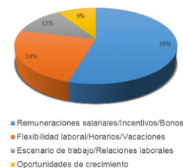
Fig. 2. Tipos de incentivos)

El 55% de los estudios analizados confirman que una de las estrategias que más motivan a los trabajadores es el recibir compensaciones laborales por medio de incentivos económicos, ya sea por medio de bonos o remuneraciones salariales. Aseguran que monetariamente se incentiva al empleado a cumplir con sus responsabilidades, y a