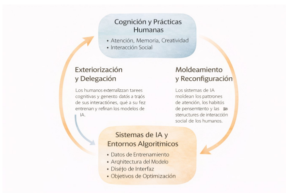
Fig. 2. Modelo de co-evolución dinámica entre cognición humana y sistemas de inteligencia artificial